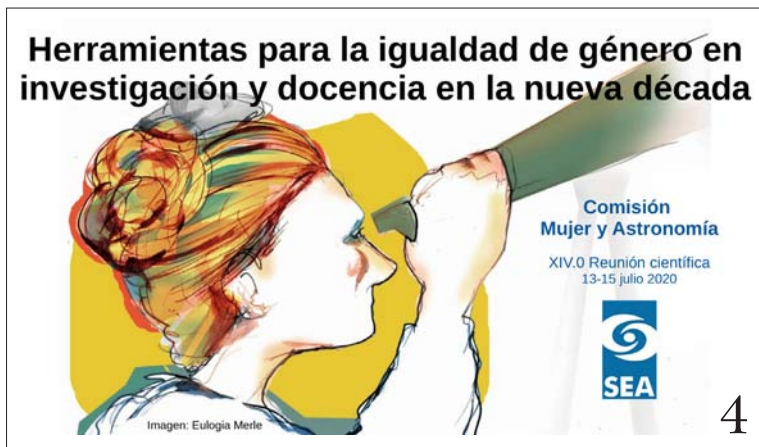
FIGURA 4. Presentación del grupo de trabajo «Mujer y Astronomía».