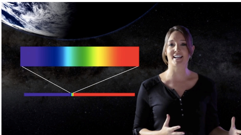
Figure 3: Still from the video “Are there other kinds of light?”.

o seleccionamos las imágenes y animaciones que cada vídeo debía contener. Cada vídeo fue rodado en alta definición, utilizando equipos profesionales de sonido e imagen.