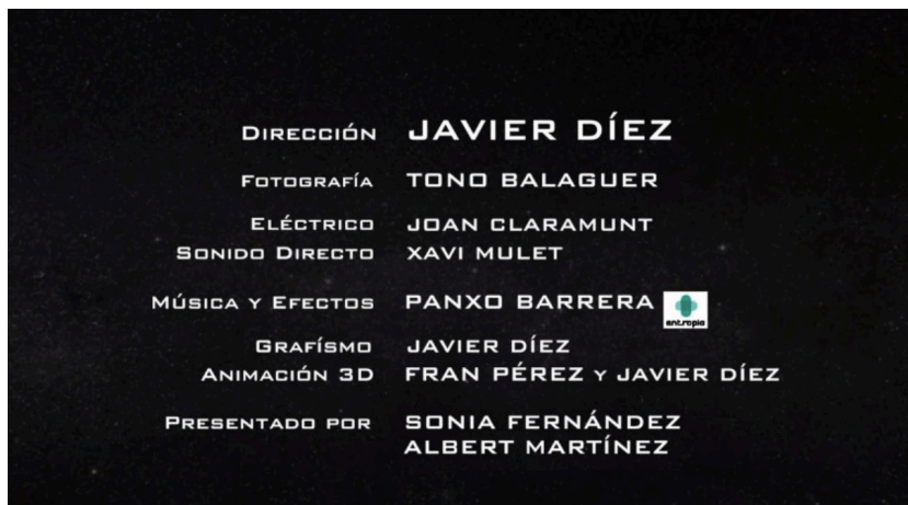
Figure 5: Closing credits from one of our videos.