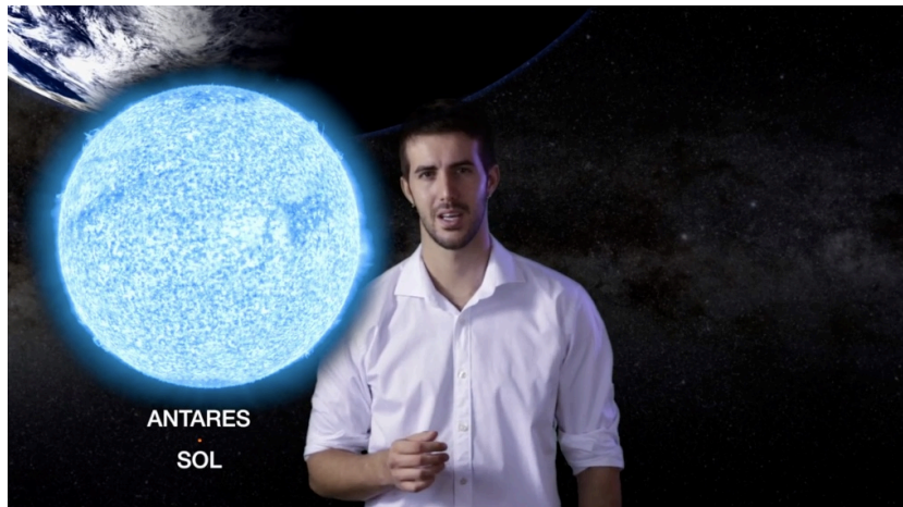
Figure 4: Still from the video "What is a supernova?".